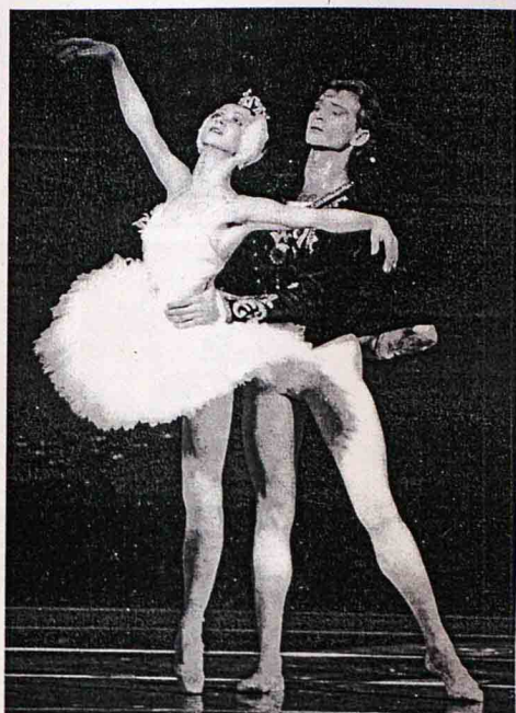
Variedad: El ballet clásico y el contemporáneo se darán la mano en la Temporada de Danza del Auditorio, en la que actuarán el Ballet Nacional Ruso (i) y Los Ballets de Monte-Carlo