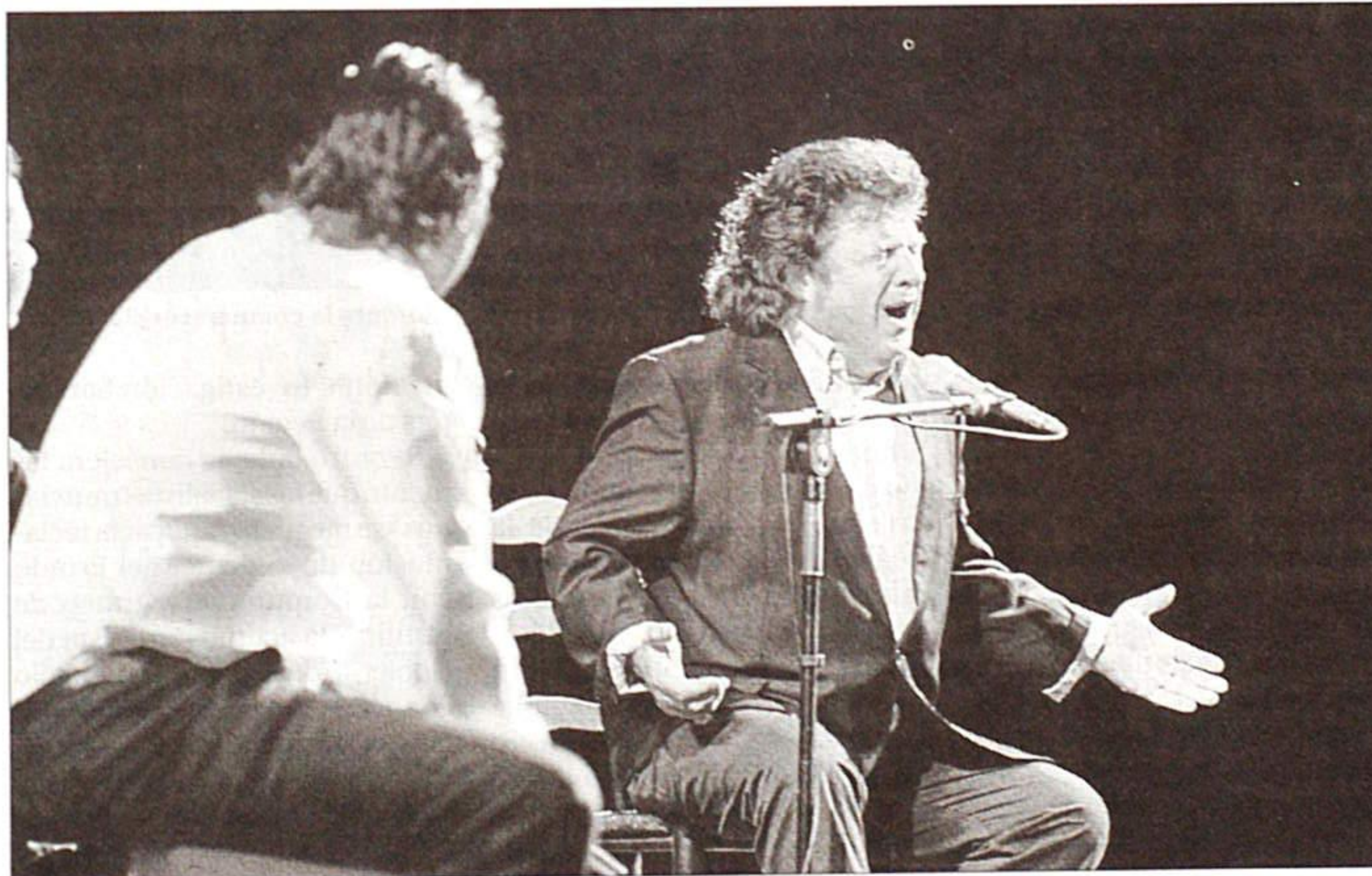
Enrique Morente volverá a unir su voz a la música de los rockeros granadinos Lagartija Nick